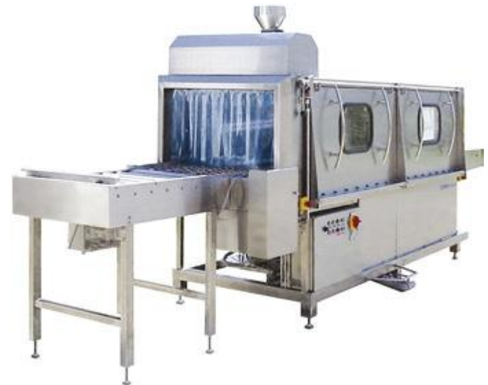
Durchlaufwaschanlage mit Tauchweiche