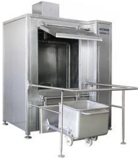
Kutterwagen- und Containerwaschanlagen

Komplett verschweißte, stabile Maschinengehäuse und Konstruktionen garantieren Langlebigkeit und Robustheit. Anlagen bieten maßgeschneiderte und passende Lösungen für verschiedenste Reinigungsaufgaben von Brotkörben und Kuchenblechen über Fleischbehälter und Paletten bis hin zu Flaschen und Gebinden des Nonfood-Bereichs.