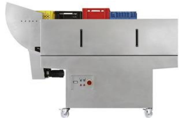
Ausgabe eines Kistenwaschers